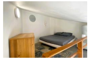
image not found or type not allowed or image not found or type not allowed or type not allowed or type not allowed